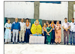
मिवानी। आयोजित कार्यक्रम में प्रतिभाओं को सम्मानित करते हुए।