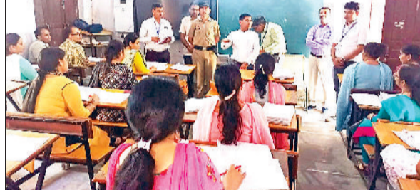
भिवानी। मूल्यांकन केंद्र का निरीक्षण करते हुए।