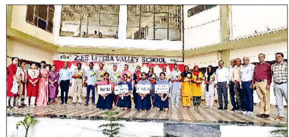
मिवानी। जी लिट्रा स्कूल में आयोजित कार्यक्रम में कर्मचारी व अन्य।